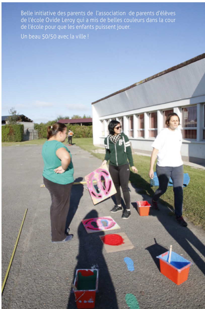
Belle initiative des parents de l'association de parents d'élèves de l'école Ovide Leroy qui a mis de belles couleurs dans la cour de l'école pour que les enfants puissent jouer. Un beau 50/50 avec la ville !