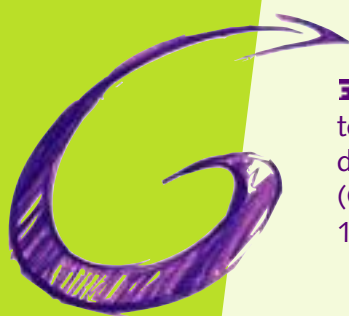
Le G de Gohelle traduit le dynamisme et l'innovation par un élan graphique.

2. Loos-en-Gohelle est une ville éco-citoyenne agissant pour la qualité de son cadre de vie et impulsant le concept de développement durable pour la ville, la planète, et les générations futures.